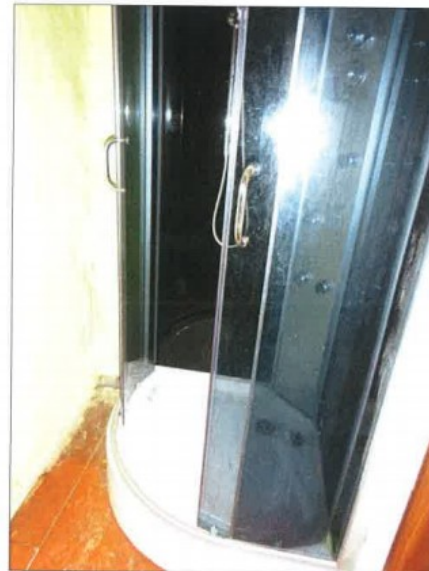
Widok fragmentu łazienki z wc.