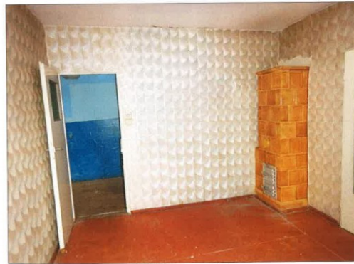
Widok fragmentu pokoju.