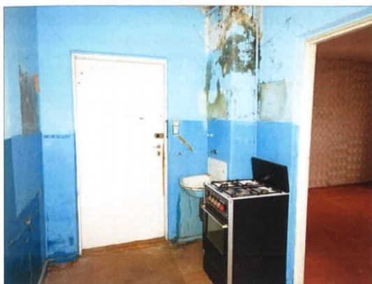
Widok fragmentu kuchni.