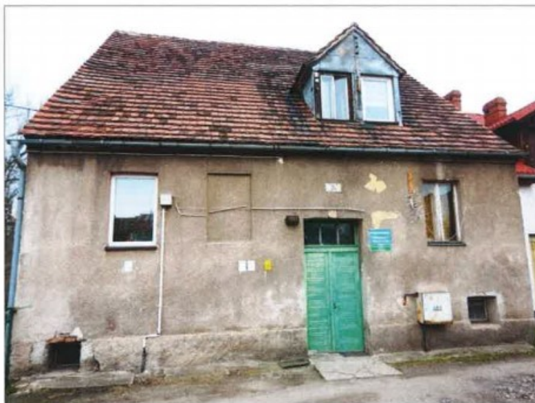
Widok elewacji frontowej – ul. Włókiennicza nr 5a.

na sprzedaż lokalu mieszkalnego Nr 3 znajdującego się w budynku położonym w Lubaniu przy ul. Włókienniczej 5a wraz z udziałem we współwłasności nieruchomości gruntowej (działka nr 57/13, AM 18, Obręb II o powierzchni 478 m 2 , JG1L/00028431/2)