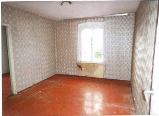
Widok fragmentu pokoju.