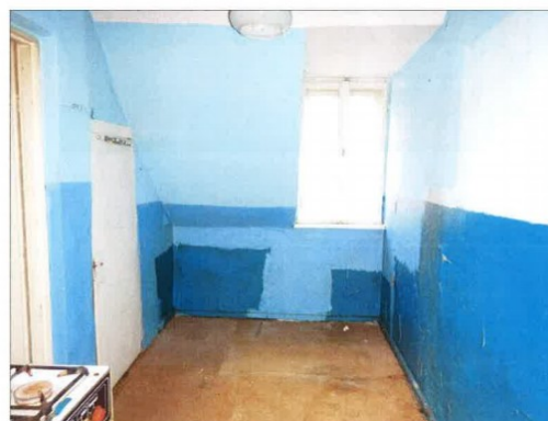
Widok fragmentu kuchni.